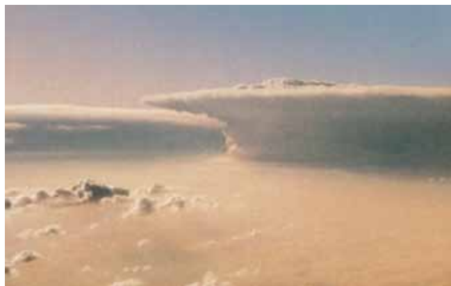
Abb. 5: Wolke des Hagelgewitters in München, 12.7.1984, 19 Uhr, aus 10.500 m Höhe. Dieses Gewitter richtete einen Schaden von fast 2 Milliarden DM an.

Wir freuen uns, in diesem Jahr 2011 die 30. Ausgabe des Kalenders und damit 30 Jahre ehrenamtliche Arbeit zahlreicher Unterstützer des Kalenders zu feiern. Ihnen und natürlich allen Beziehern des Kalenders möchten wir herzlich danken!