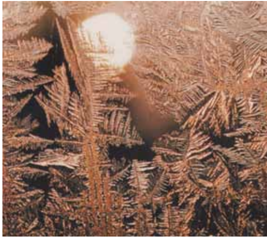
Abb. 4: Wer kennt schon noch Eisblumen am Fenster? (© Walter Fett, Meteorologischer Kalender 1988).

Pettifer sowie einigen anderen Mitgliedern der RMS übernommen. Da die RMS 3000 Kalender bestellte und 1000 Kalender nach Frankreich gingen, wurde eine Auflage von gut 15000 gedruckt. Der Verkauf in Deutschland ließ jedoch nach, so dass fast 1000 Kalender übrig blieben, dennoch ein guter Gewinn der DMG zufloss.