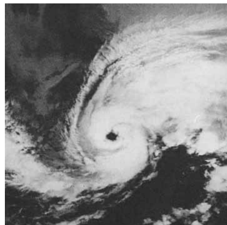
Abb. 2: Gezeigt wird aus dem ersten Kalender 1983 ein „wirbelsturmartiges Tief“ im Seegebiet zwischen Sizilien, Libyen und Griechenland am 26.1.1982, das – ähnlich wie auch Polartiefs – sich derartig stark entwickeln kann, wenn Kaltluft über relativ warmes Wasser weht.

Hier ist ein Dank auch an viele Mitarbeiterinnen und Mitarbeiter zahlreicher meist meteorologischer und geo-graphischer Institute und Dienste zu richten: Sie haben sich der Verteilung der Kalender in ihren Instituten dankenswerterweise und sehr erfolgreich ange-